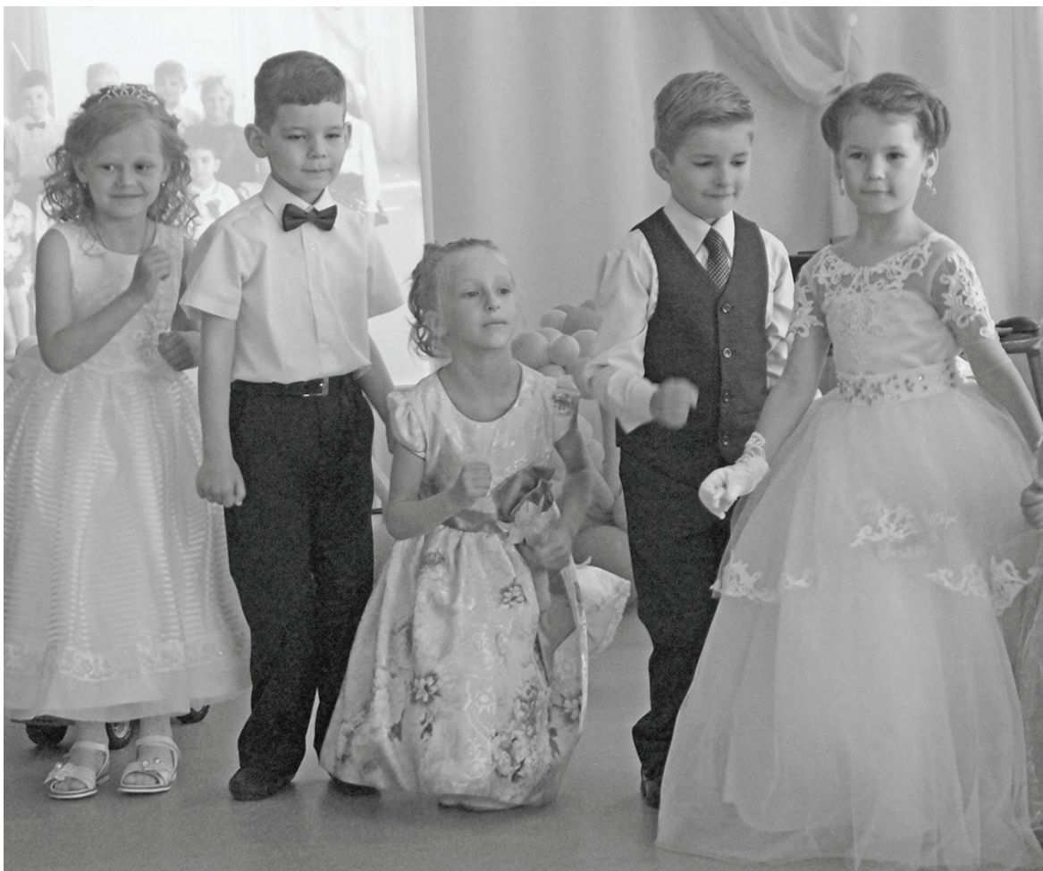
Дети - наше счастье! Выпускной в «Ягодке», 2017 год.

◆ 1 июня – Международный день защиты детей