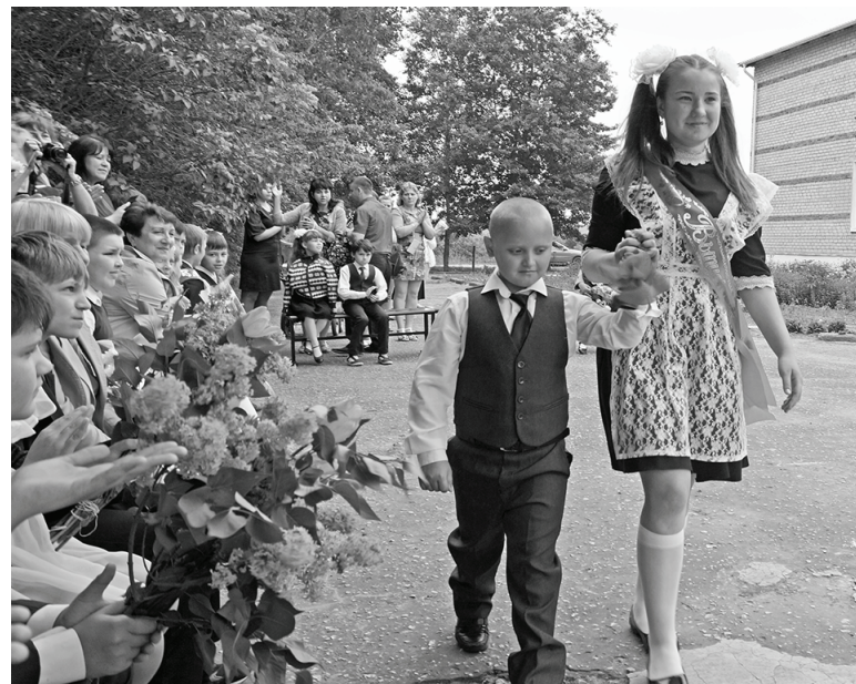
Село Вертное. Звенит, звенит звонок грустный и веселый.

Далее один номер сменялся другим: вот «первоклашки» со своим наставником в стихотворной шуточной форме поведали всем о