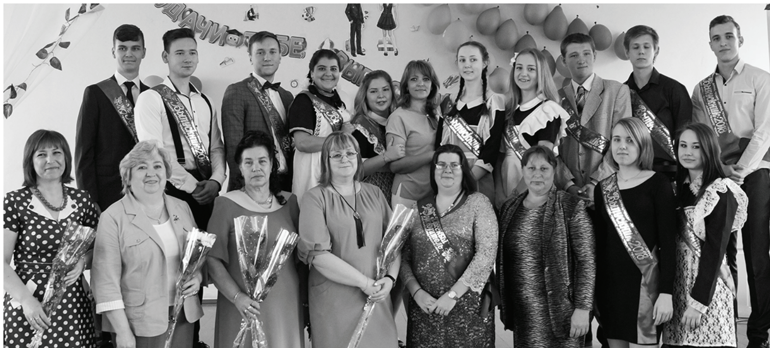
ДСШ №1. Одна школа – одна команда.