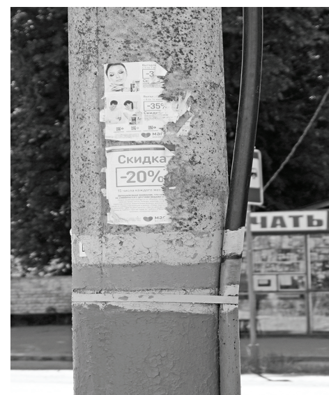
Здесь не место для рекламы!

Во многом о нашей культуре можно судить по состоянию контейнерных площадок.