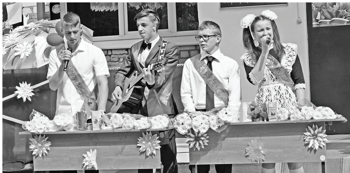
Споёмте, друзья! Село Вертное.

25 мая в школах района для выпускников прозвенел последний звонок. В этом году 11-й класс оканчивают 47 наших юных земляков, 9-й класс – 89.