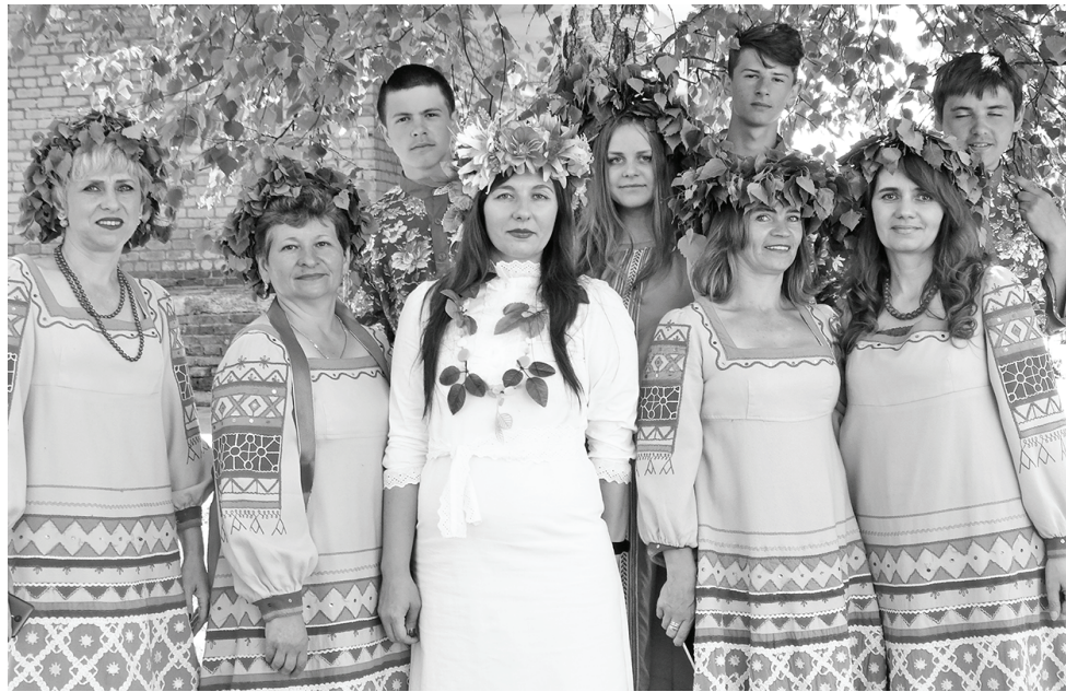
Участники праздника на станции Думиничи.

Жила-была Березонька. Спала она крепким сном всю долгую зимушку. А весна-